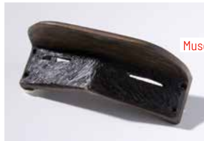
Musée du Nouveau Monde

Photos utilisées en médaillon sur le visuel de couverture : © Max Roy et © Christian Vignaud