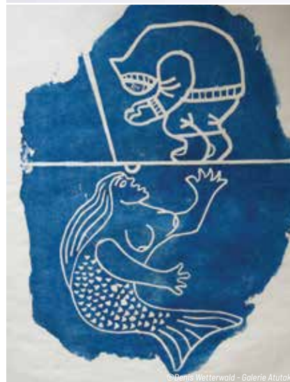
© Denis Wetterwald - Galerie Atutak